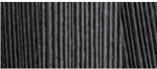
frassino sabbaiato tinto nero opaco matte sand-blasted black ash

84 x 74 h70 cm – 32 3 / 4 x 28 3 / 4 h27 1 / 4 "