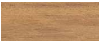
iroko naturale natural iroko