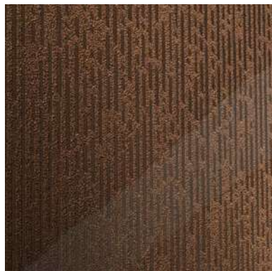
marrone brillante brilliant brown