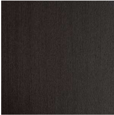
termotrattato nero heath-treated black