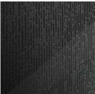
nero brillante brilliant black