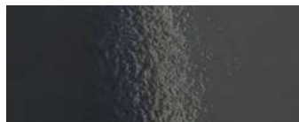
vetrofusione fumo smoked colour fused glass