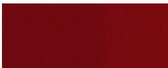
laccato rabarbaro rhubarb lacquered