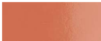
laccato palissandro rosewood lacquered