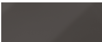
laccato asfalto asphalt lacquered