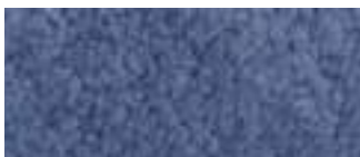
montone avio avio mouton