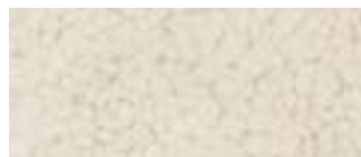
montone bianco white mouton