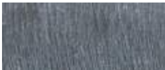
metallo grezzo spazzolato brushed unfinished metal