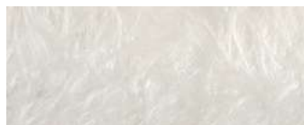
vetroresina naturale natural fiberglass

43 x 40 h45 cm - 16 3 / 4 x 15 1 / 2 h17 1 / 2 "