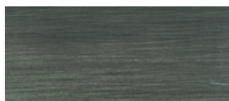
metallo brunito spazzolato a mano hand-finished burnished metal