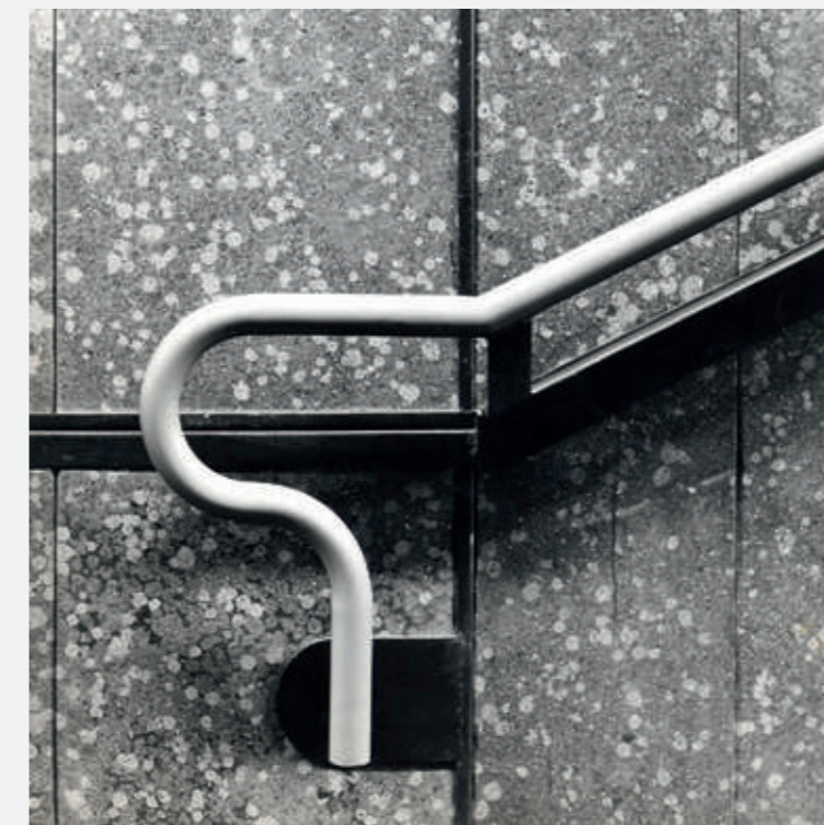
Corrimano della Metropolitana Milanese. Progetto di F. Albini e F. Helg, 1964/ Handrail of the Milan Underground. Project by F. Albini, F. Helg, 1964

Lincoln 13L589 — Struttura verniciata rosso opaco/Matt red painted/Matt rot lackiert/Vernie rouge mat