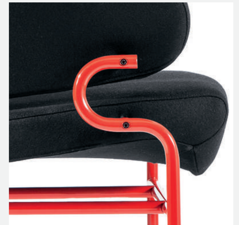
Dettaglio della struttura portante della poltrona Tre Pezzi, ispirato al corrimano della MM/ Tre Pezzi armchair: structure detail inspired by handrail of Milan Underground