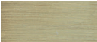
ottone satinato satin-finished brass