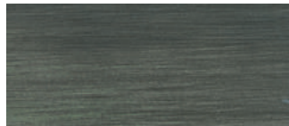
metallo brunito spazzolato a mano hand-finished burnished metal