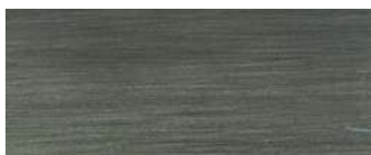
metallo brunito spazzolato a mano hand-finished burnished metal