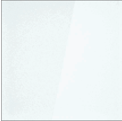
vetro trasparente transparent glass