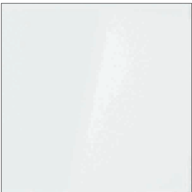
vetro extralight acidato retroverniciato bianco white back-painted and etched extralight glass