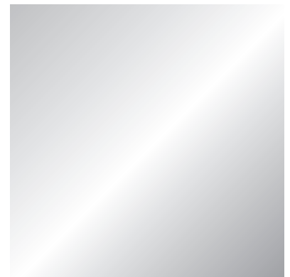
vetro extralight retroargentato extralight back-silvered glass