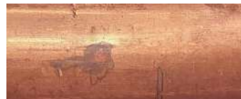
rame acidato etched copper