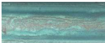
rame acidato verderame verdigris etched copper