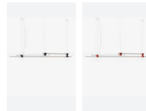
075 S4 03