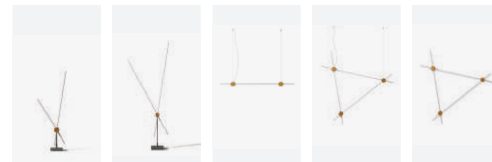
Table, p. 60