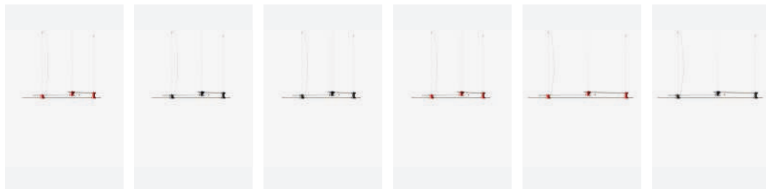
075 S3 01

DE Diese Familie mit szenografischen Leuchten ist eine Weiterentwicklung der Wandinstallation von Tobia Scarpa, die mit einer auf den ersten Blick schlichten Konstruktion und einer modernen und innovativen Technologie zum Leben erweckt wird. Das Konzept von EITIE, ein Palindrom, das eine Hommage an das Alter von Scarpa ist, setzt die Idee einer Lichtlinie um, die durch die charakteristischen runden Verbindungen verschiedene Konfigurationen annimmt. Jede Leuchte besteht aus zwei oder drei Lichtlinien, die dank der schwarzen runden Verbindungselemente aus Metall mit Details in Silber und einer hochmodernen Technologie in ihrem Inneren in verschiedenen Kompositionen angeordnet werden können.